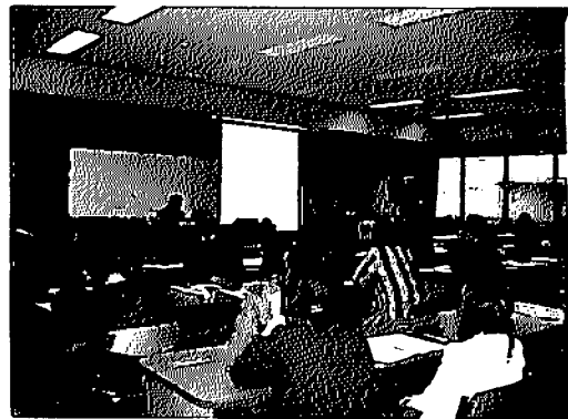
(表) 電子ジャーナル利用説明会参加者数